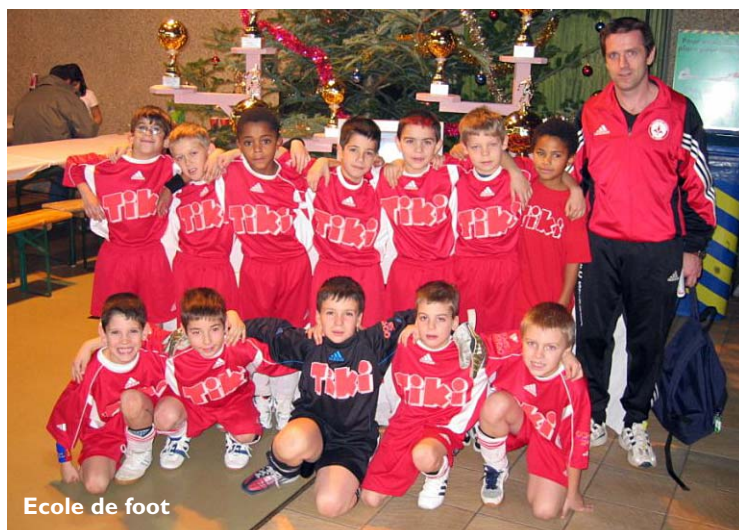
Ecole de foot