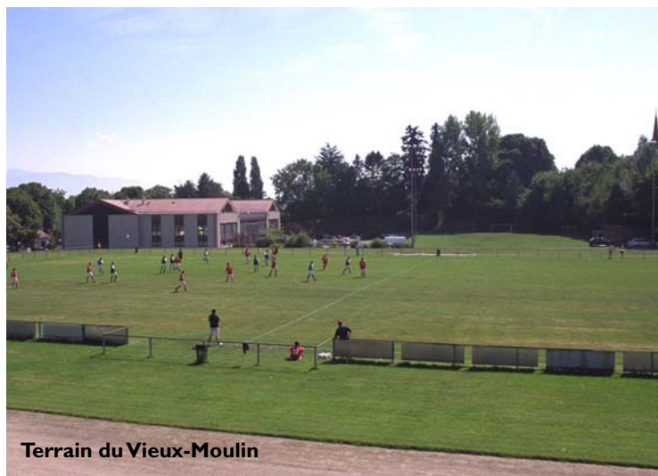
Terrain du Vieux-Moulin