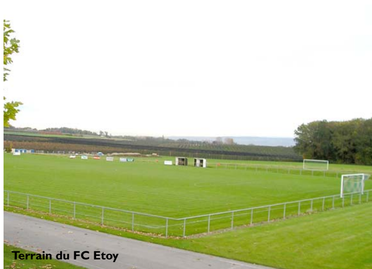
Terrain du FC Etoy